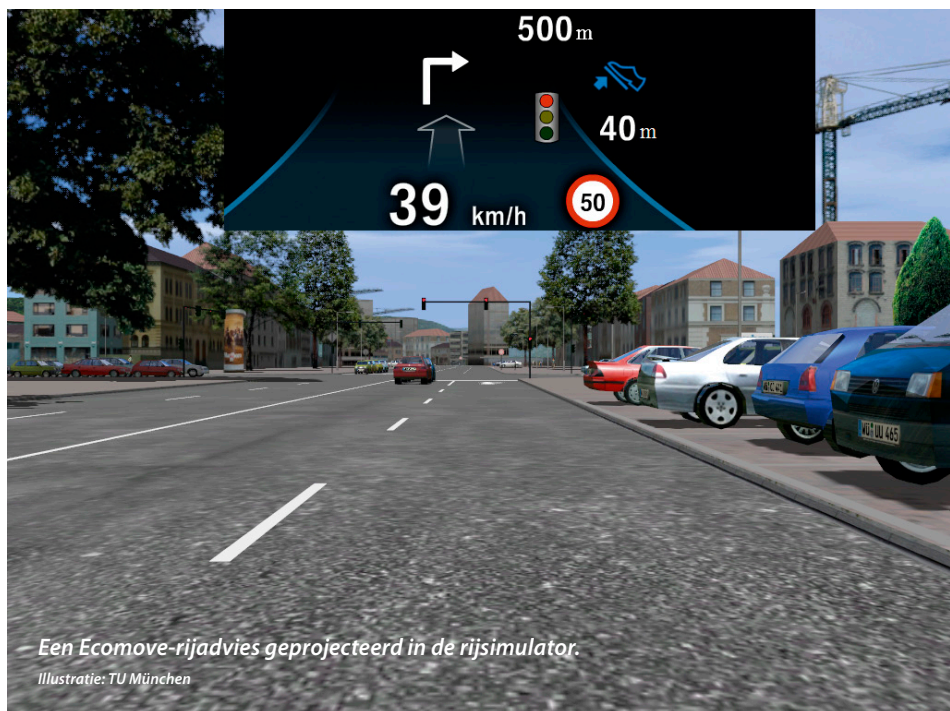
Een Ecomove-rijadvies geprojecteerd in de rijnsimulator.